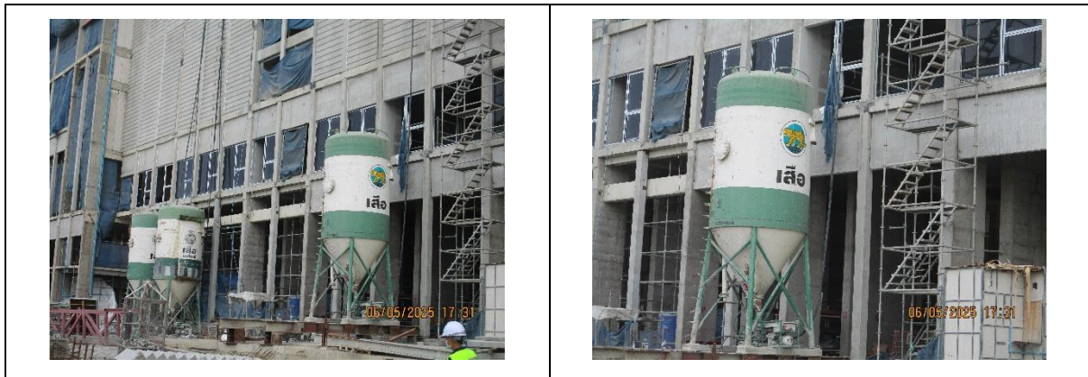
รูปที่ 10 ปูนซีเมนต์