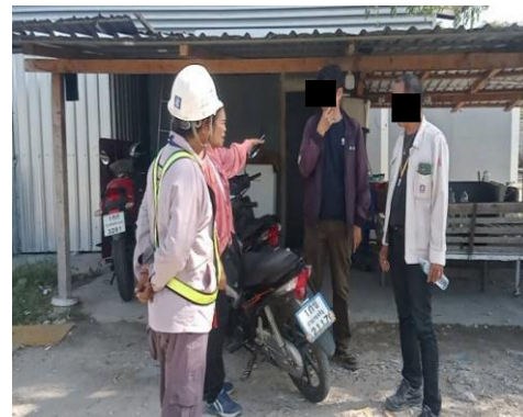
รูปที่ 3 เจ้าหน้าที่รับเรื่องร้องเรียน