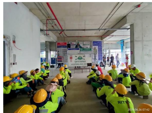
รูปที่ 36 คนงานแต่งกายด้วยชุดของบริษัทผู้รับเหมา