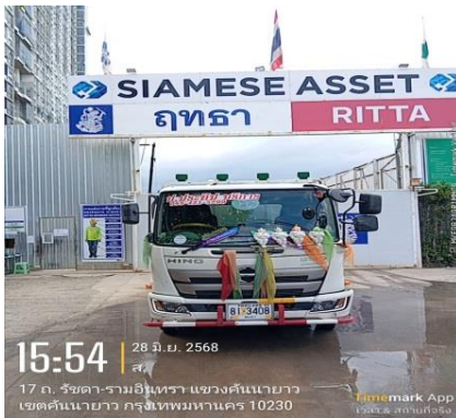
รูปที่ 15 รถบรรทุกพร้อมเบอร์ติดต่อ