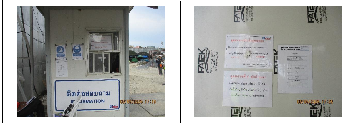
รูปที่ 39 ป้อม รปภ.