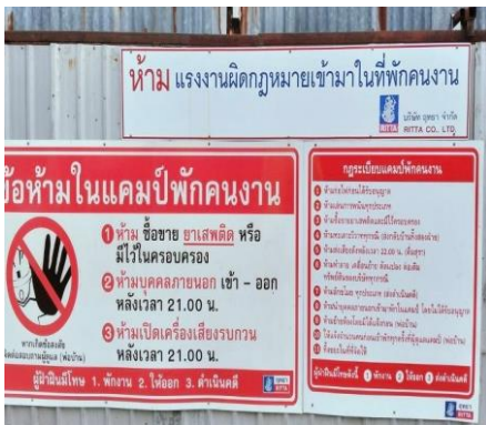
ป้ายห้ามบุคคลภายนอกเข้ามายังพื้นที่บ้านพัก