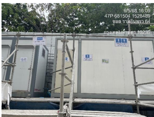
รูปที่ 17 ห้องน้ำ