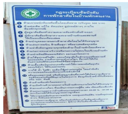
กฎระเบียบบ้านพักคนงาน