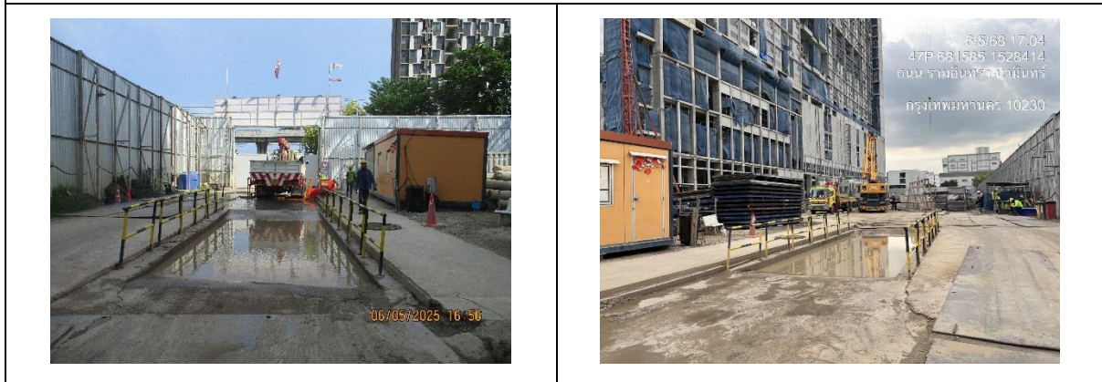
รูปที่ 11 บ่อล้างล้อ