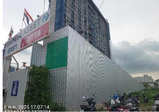
รูปที่ 1 รั้วทึบชั่วคราว (Metal Sheet) รอบพื้นที่โครงการ