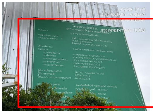
รูปที่ 2 ป้ายชื่อและรายละเอียดโครงการ