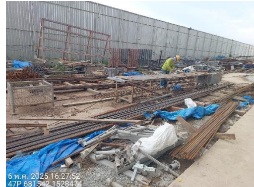
รูปที่ 14 พื้นที่สำหรับตัด/เจียรวัสดุ