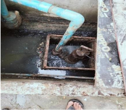
ระบบบำบัดน้ำเสีย