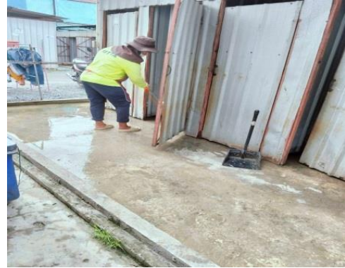
ทำความสะอาดห้องน้ำ