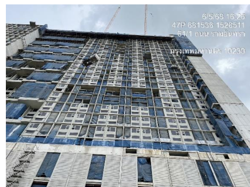
รูปที่ 7 ผ้าใบก่อสร้างกันฝุ่น Mesh Sheet