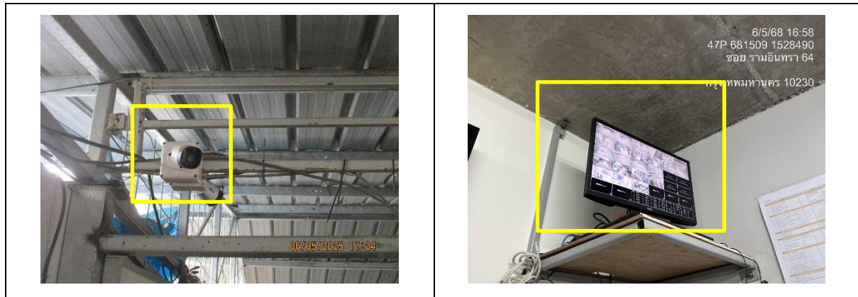
รูปที่ 37 กล้องวงจรปิด