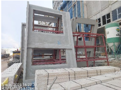
รูปที่ 13 ผนังสำเร็จรูป