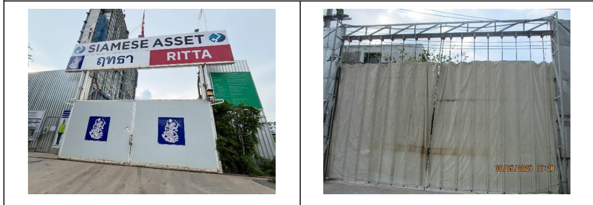
รูปที่ 38 ทางเข้า-ออกปิดทึบ