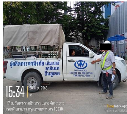
รูปที่ 16 ผ้าใบคลุมรถบรรทุก