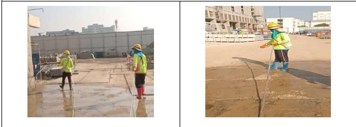
รูปที่ 12 การฉีดพรมน้ำภายในพื้นที่โครงการ