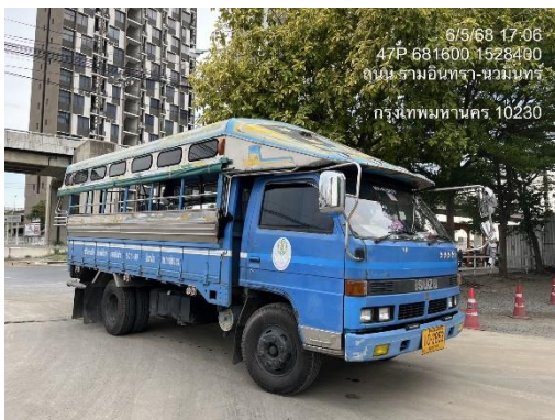
รูปที่ 36 ที่จอดรถรับ-ส่ง คนงาน